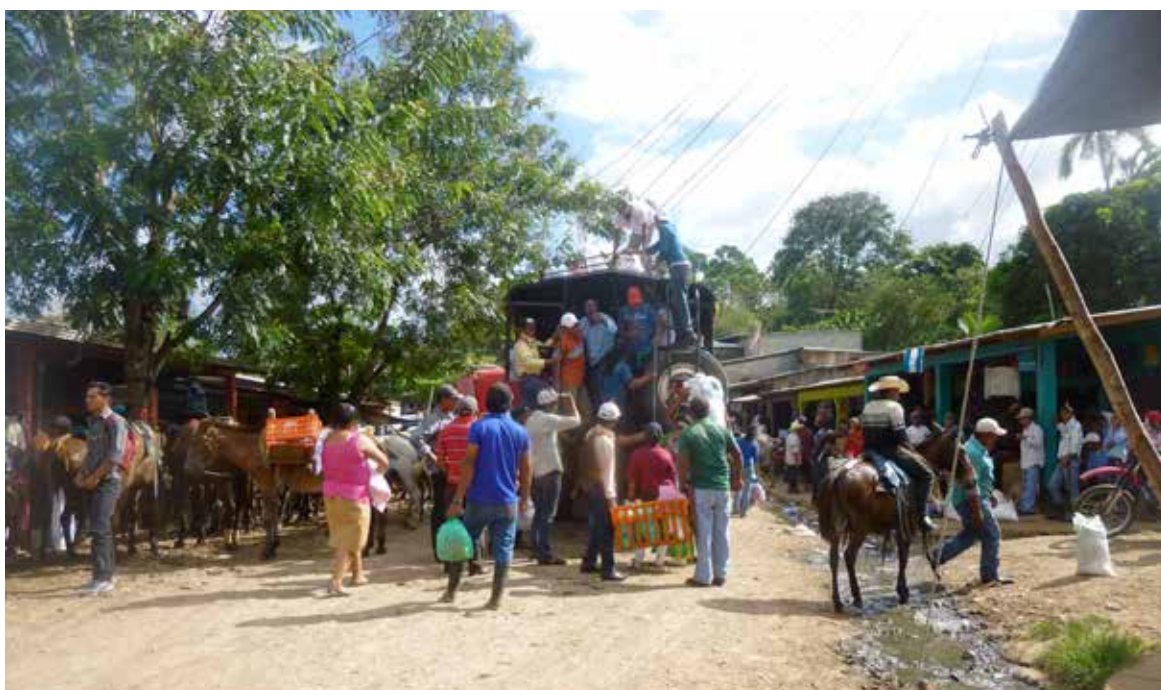
Colonia La Unión – Nueva Guinea. 10 de marzo de 2016. Ambiente de la calle principal de la Colonia la Unión, donde campesinos bajan de sus comunidades a vender y comprar productos. La fotografía fue tomada antes de la reunión con el grupo focal de la Colonia la Unión.

Los Estados partes, como Nicaragua, al Pacto internacional de derechos económicos sociales y culturales reconocen en el artículo 11 (1) el derecho de toda persona a una vivienda adecuada y se comprometen a tomar medidas apropiadas para asegurar la efectividad de este derecho 23 . El Comité de Derechos Económicos, Sociales y Culturales ha detallado en su observación general N° 7 (1997) 24 acerca del derecho a una vivienda adecuada (párrafo 1 del artículo 11 del Pacto) las necesarias salvaguardas para proteger a las personas de expropiaciones arbitrarias referidas como desalojos forzosos de su lugar de residencia 25 y se pueden resumir así: Los desalojos autorizados por una ley para ser conformes con el derecho internacional y los derechos humanos requieren: a) hacerse únicamente con el fin de promover el bienestar general 26 ; b) ser razonable y proporcional; c) estar reglamentado de tal forma que se garantice un recurso efectivo en contra de la decisión del desalojo y una indemnización y rehabilitación completas y justas a favor de las personas objeto del desalojo; d) llevarse a cabo de acuerdo con el derecho internacional relativo a los derechos humanos, e) respetar el derecho a la consulta previa, libre e informada.