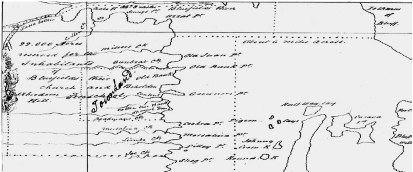
La ilustración muestra el bosquejo de la tierra colectiva otorgada por el Rey Miskito Robert Charles Frederick a la comunidad Creole de Bluefields, 1841 10

persona o familia, ni parcelas específicas, pero constituía un bosquejo de sus linderos generales. Aparentemente la tierra fue distribuida posteriormente de manera igualitaria, dependiendo del número de los miembros de cada familia, las familias más numerosas recibieron hasta 800 acres y los individuos que recibieron menos recibieron desde 25 acres. La entrega se realizó también atendiendo a criterios económicos, sociales y raciales de la época al dar solo pequeñas porciones a los esclavos; ya que se designó solamente 200 acres para todos los esclavos estimándose 4 acres para cada uno; y también teniendo criterios de “moralidad” al otorgar solamente la mitad, a los hijos ilegítimos de lo entregado a los hijos legítimos. También hubo una designación para lo que sería el hospital, la escuela y la iglesia, todo en el título colectivo. 9