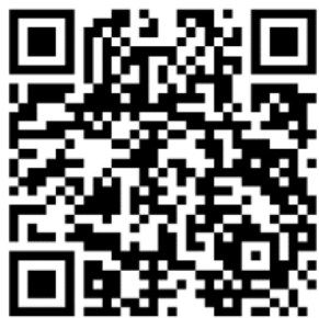
Inicio de las protestas