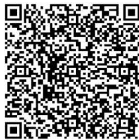
Informe “Nicaragua: Seis meses de crisis socio-política; días grises para el periodismo independiente”.