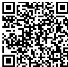
Informe: Sembrando el terror: de la letalidad a la persecución en Nicaragua.

Después de cinco años inactiva, la APN de León reactivó operaciones y eligió a su junta directiva con el objetivo de unificar al gremio periodístico de